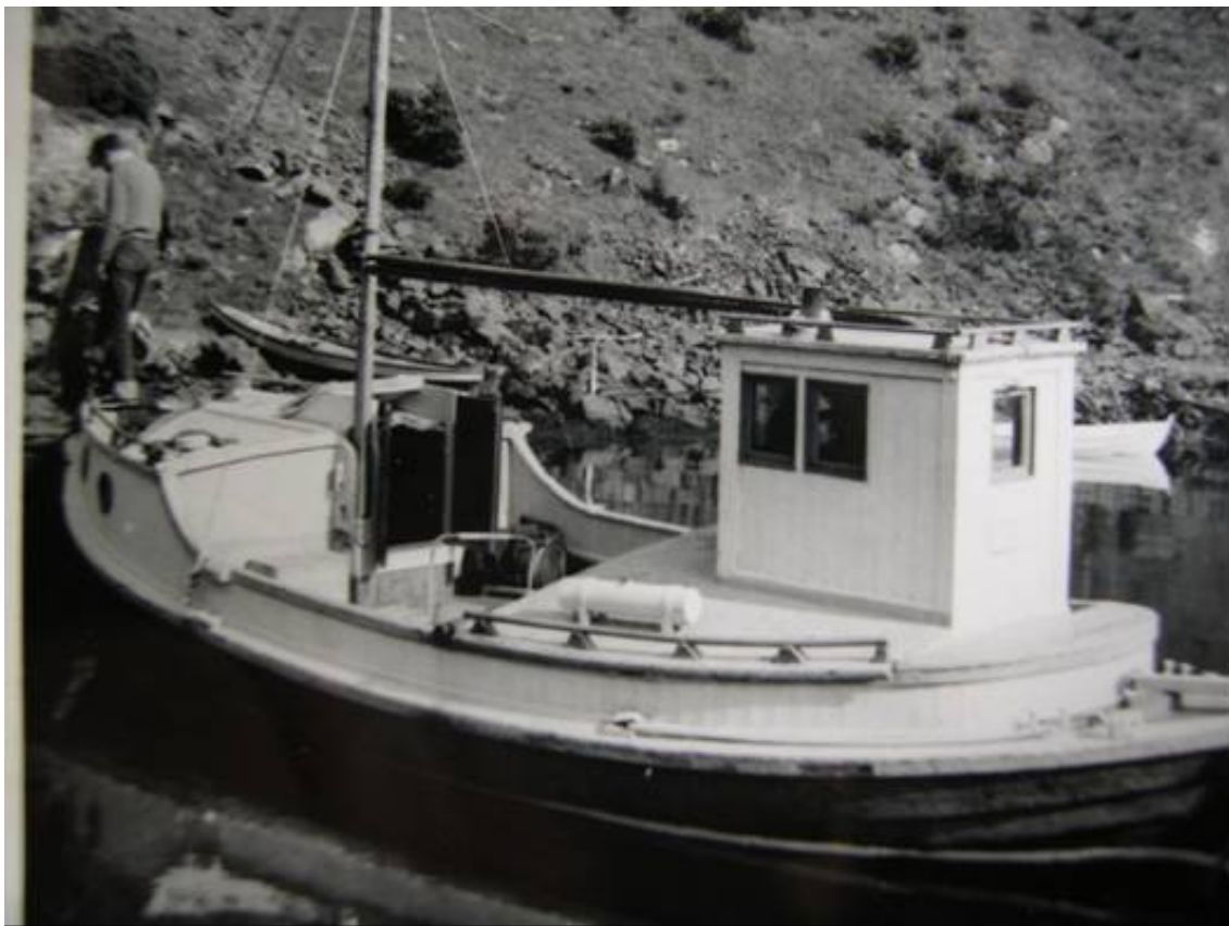
I 1958 fikk "Tempo" skiftet hud og ble kravellbygget i Slåttavikå, Ådnes på Bømlo.