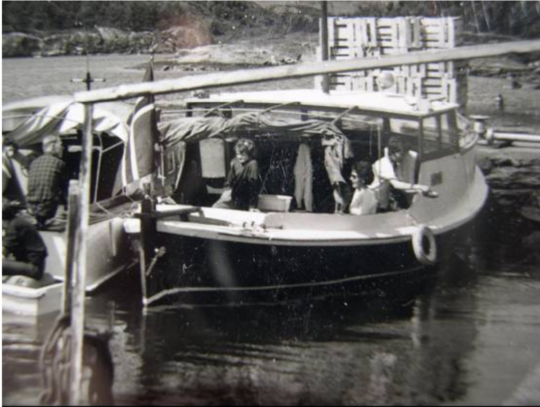
I 1960 ble 5-6 HK Rubb byttet ut med en 8-12 HK 1 sylindret Marna dieselmotor.